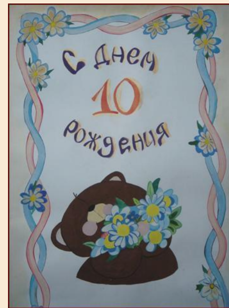
Плакат, посвященный 10-летию ФМО, подготовленный студентами кафедры

Однако многое еще предстоит сделать. К примеру, уже разрабатывается макет специализированной газеты кафедры, где будут отражаться самые последние туристские новости, изменения в нормативно-правовой базе туризма, туристская жизнь факультета в целом. К делу создания газеты планируется подключить студентов, преподавателей и ведущие туристские фирмы столицы и республики.