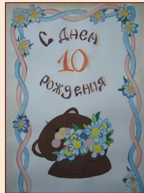
Плакат, посвященный 10-летию ФМО, подготовленный студентами кафедры

Однако многое еще предстоит сделать. К примеру, уже разрабатывается макет специализированной газеты кафедры, где будут отражаться самые последние туристские новости, изменения в нормативно-правовой базе туризма, туристская жизнь факультета в целом. К делу создания газеты планируется подключить студентов, преподавателей и ведущие туристские фирмы столицы и республики.