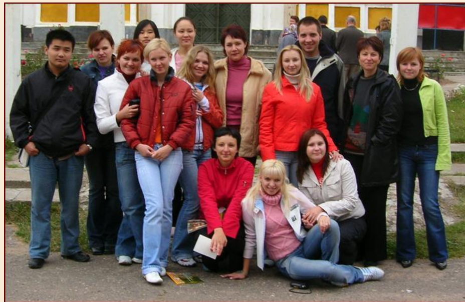
Поездка по маршруту Будслав-Глубокое-Удзело-Мосар