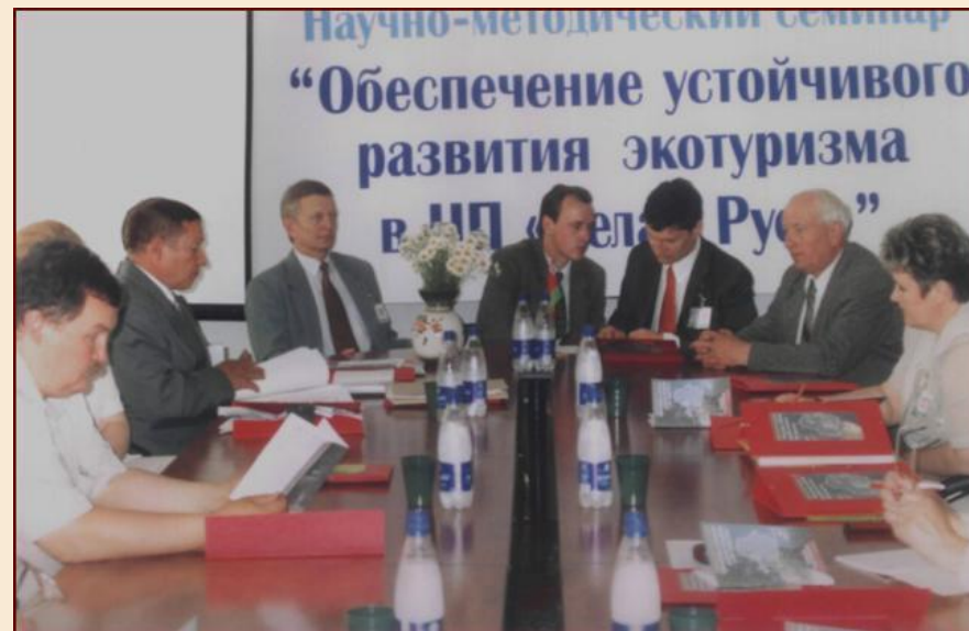
научно-методический семинар «Обеспечение устойчивого развития экотуризма в НП «Белая Русь»

Профессорско-преподавательский кафедры принимал участие (2000, 2004г.) в разработке проекта Национальной программы развития туризма Республики Беларусь на 2000-2005гг., 2006–2010 гг.