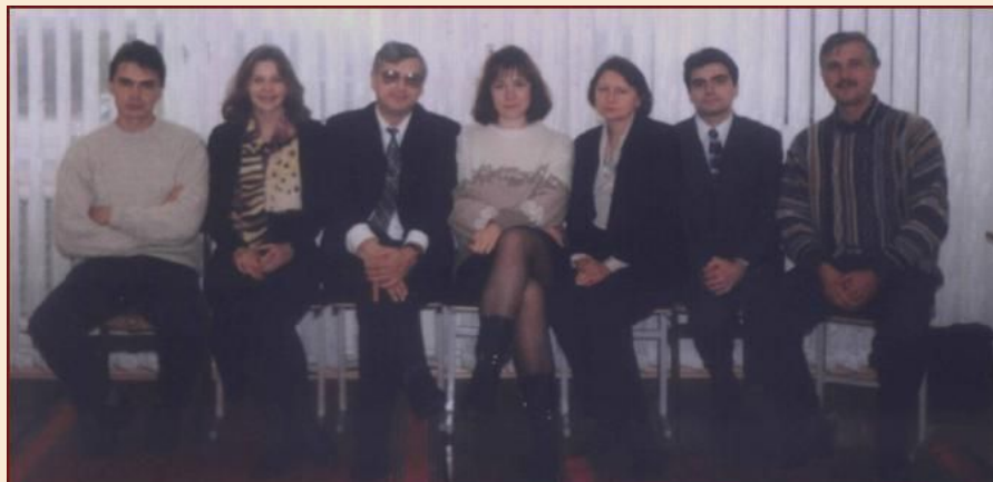
Первоначальный состав Кафедры

Это дает им возможность работать в различных областях деятельности (туристской индустрии, банковской сфере, внешнеэкономических правительственных учреждениях).