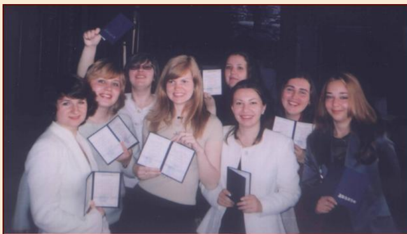
Выпускники кафедры с заслуженными дипломами

И только так – через упорство и смекалку, знания и интеллект, расширение кругозора и востребованные жизнью проекты – кафедра будет продолжать оказывать стимулирующее воздействие на развитие национального туризма.