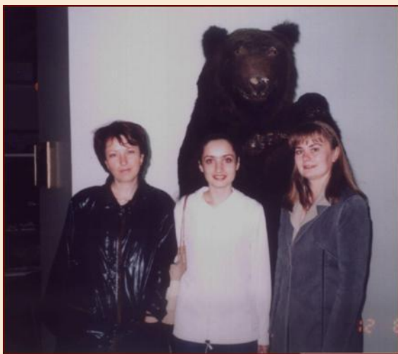
В музее Березинского заповедника

Помимо обычных семинарских занятий в учебном процессе активно используются учебные экскурсии, которые помогают расширить кругозор студентов, узнать много интересного о родной стране, сплотить студенческий коллектив.