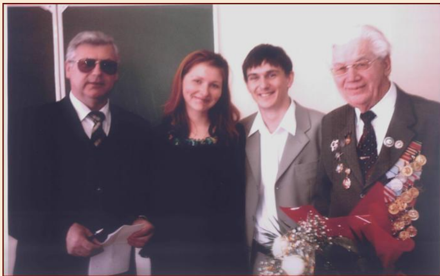
Встреча с ветераном ВОВ

Стали традиционными встречи с ветеранами Великой Отечественной войны. На них студентам рассказывают о тяжелых годах войны советского народа против фашистских оккупантов. Ветераны с болью в сердце поведают о пережитых событиях и делятся нелегкими фронтовыми воспоминаниями. Это весомый элемент в патриотическом воспитании молодежи.