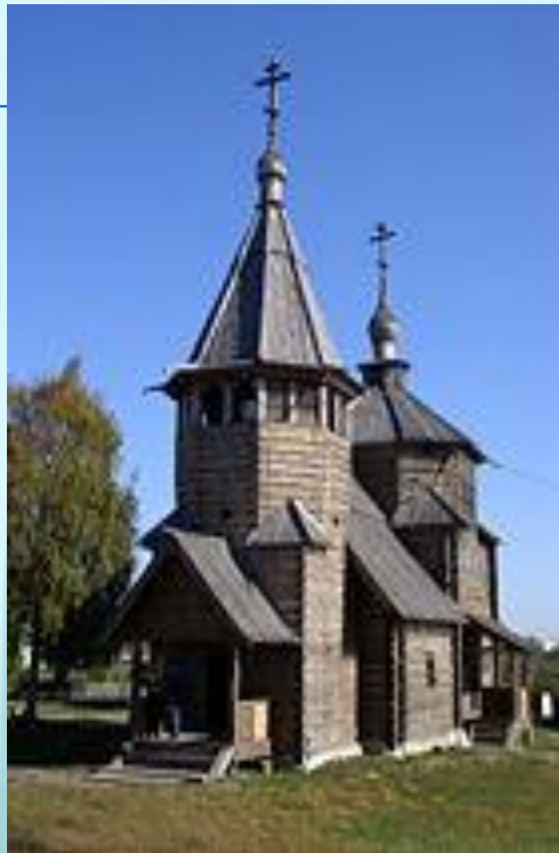
Воскресенская церковь из села Потакино

В шатровом зодчестве выделяли деревянные постройки и каменные. В русском деревянном зодчестве шатёр является распространенной, хотя далеко не единственной, формой завершения деревянных церквей. Так как с древнейших времен деревянное строительство на Руси было преобладающим, то большинство христианских храмов так же строилось из дерева. Типология церковной архитектуры перенималась Древней Русью из Византии. Однако в дереве чрезвычайно трудно передать форму купола — необходимого элемента храма византийского типа. Вероятно, именно техническими трудностями вызвана замена в деревянных храмах куполов шатровыми завершениями. Конструкция деревянного шатра проста, её устройство не вызывает серьёзных затруднений. Хотя самые ранние известные деревянные шатровые храмы относятся к XVI веку, есть основания думать, что и раньше в деревянном зодчестве была распространена форма шатра