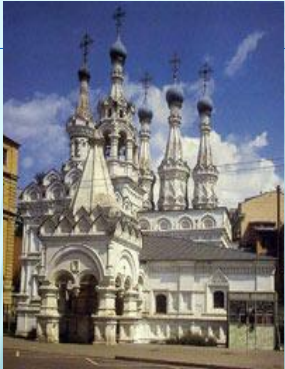
Церковь Рождества Богородицы в Путинках

Шатровое зодчество XVI–XVII вв., черпающее свое начало в традиционной русской деревянной архитектуре, является уникальным направлением русского зодчества, которому нет аналогов в искусстве других стран и народов. Шатровые храмы Московского государства – неповторимый вклад России в мировую культуру.