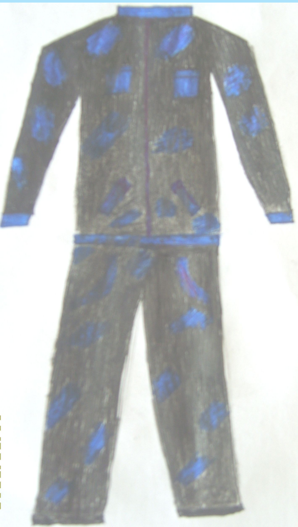
7 Б класс