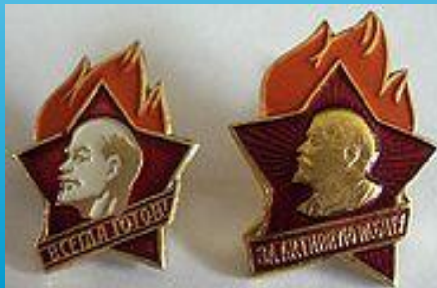
Пионерские значки (1980-е)