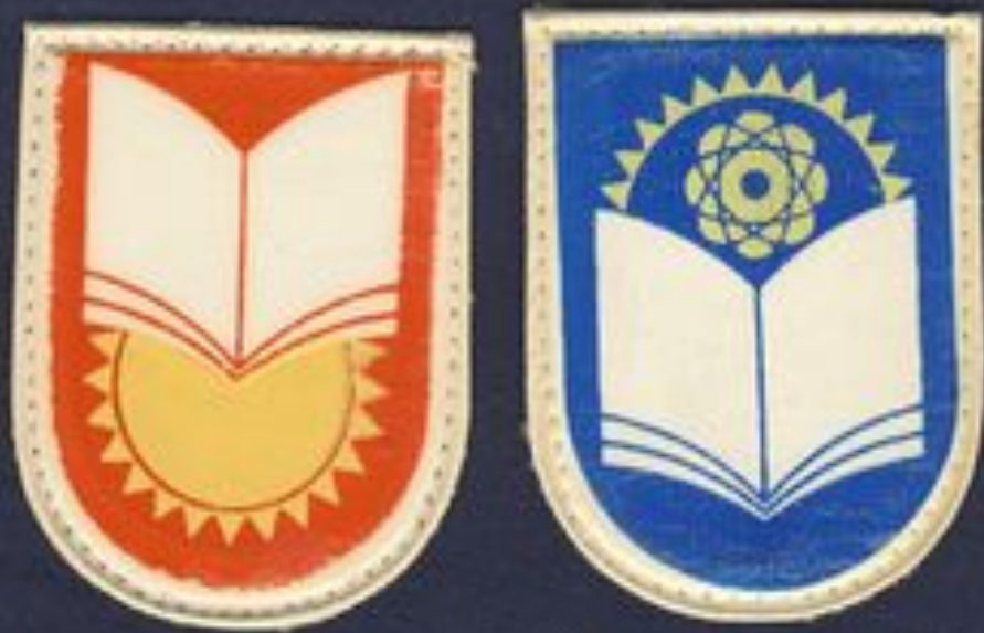
Нарукавные эмблемы (1975год)