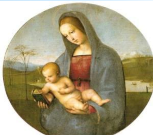
Мадонна Конестабиле Рафаэль Санти