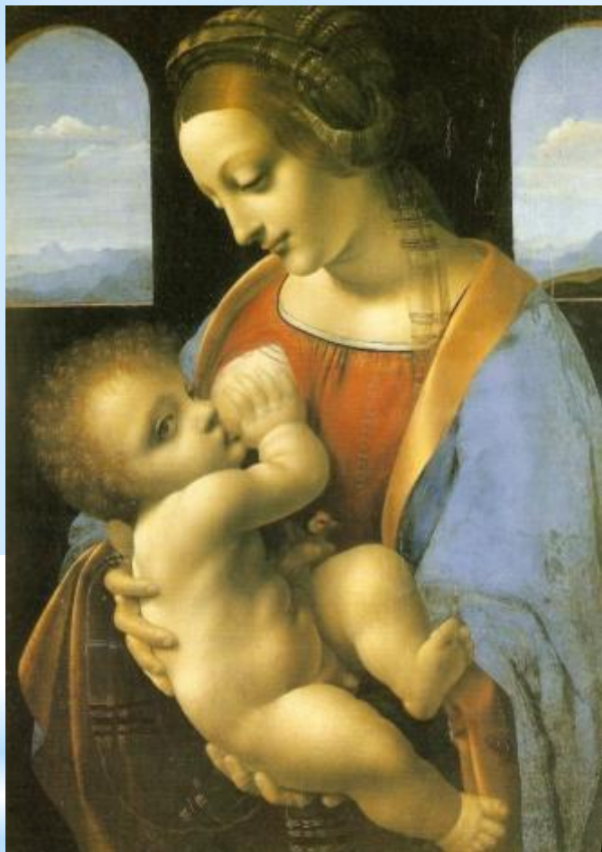
Мадонна с младенцем Леонардо да Винчи

В этот день, знаменательный самый, Ты прими благодарность мою. Мама, мама, милая мама, Я тебя всей душою люблю!