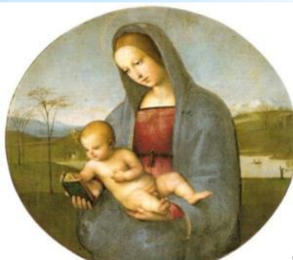
Мадонна Конестабиле Рафаэль Санти