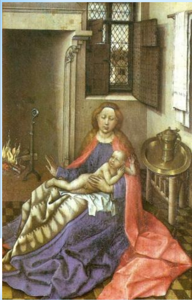
Мадонна с младенцем Робер Кампен