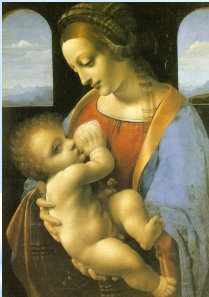
Мадонна с младенцем Леонардо да Винчи

В этот день, знаменательный самый, Ты прими благодарность мою. Мама, мама, милая мама, Я тебя всей душою люблю!