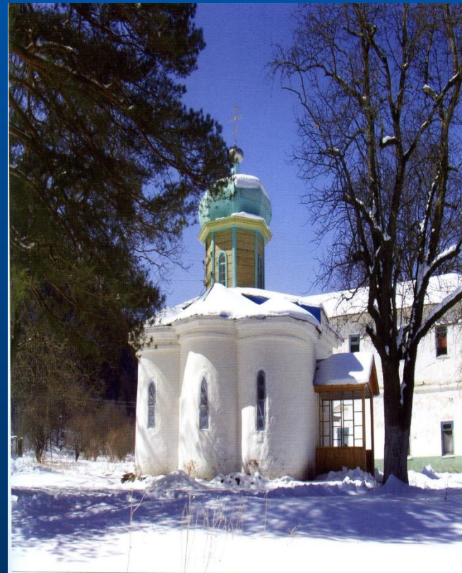
Самый древний из действующих православных храмов России — церковь пророка Илии (Южный храм X в.) в Нижнем Арзлызе Nizhny Arzlyuz. The oldest functioning Orthodox church in Russia - Church of St. Ilya the Prophet (South church of the X century)