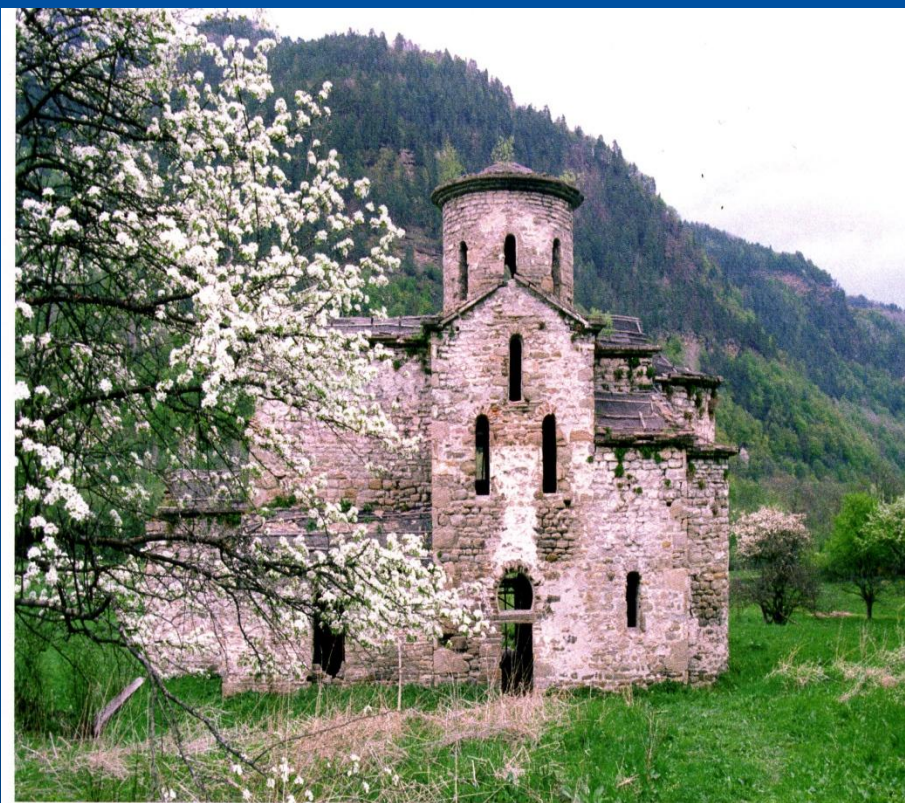
Нижний Архыз. Средний храм, IX-X вв. Nizhnij Archiz. The Middle cathedral of IX-X centuries A.D.