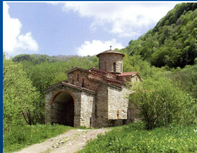
Самый древний христианский кафедральный собор России — Северный храм X в. в Нижнем Архызе The oldest cathedral in Russia – North church of the X century in Nizhny Arkhyz.