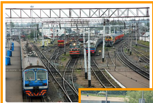
Ж/д вокзал г. Казань