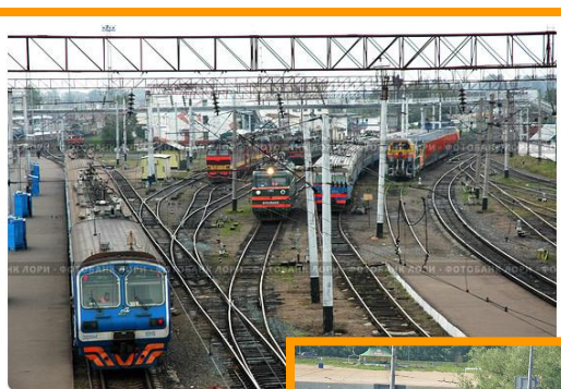
Ж/д вокзал г. Казань