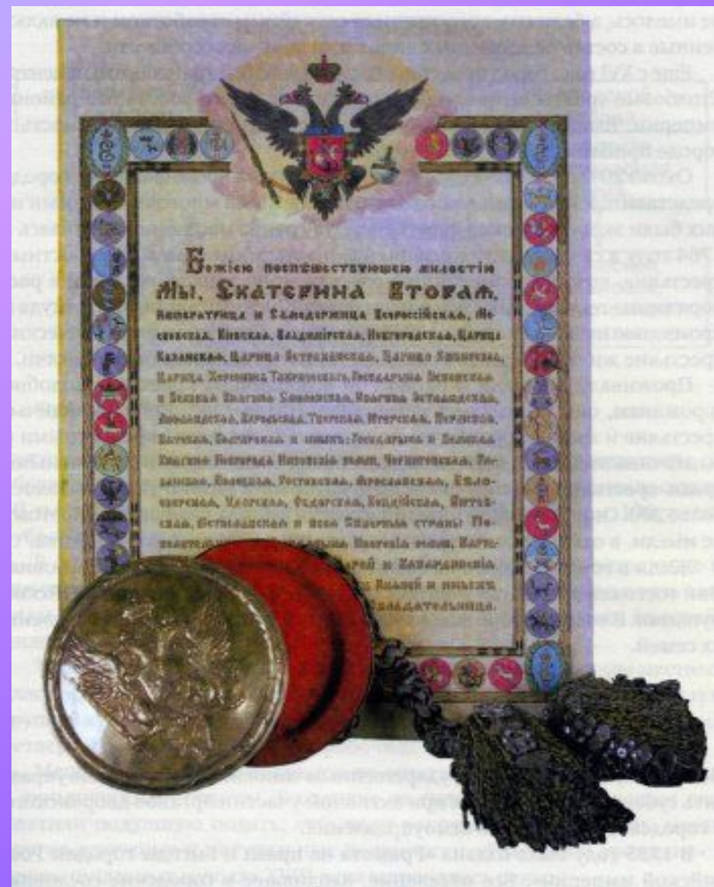
"Жалованная грамота дворянству", подписанная Екатериной II в 1785 году.