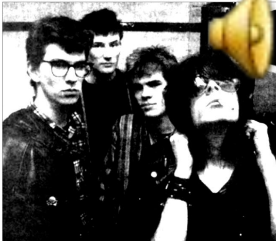
THE SISTERS OF MERCY

Субкультура готы сформировалась вокруг жанра готик-рок, одного из ответвлений новой волны. Основные группы этого жанра сформировались в конце 70-х — начале 80-х. Группы первой волны готик-рока — Sisters of Mercy, Bauhaus, Siouxsie & the Banshees, The Cure, Joy Division — были тесно связаны с панк-роком[3][7]. Однако от панка их отличали существенные музыкальные особенности: более медленный ритм исполнения, меньшая тяжесть, минорная мелодика. Многие группы (например, Sisters of Mercy) использовали драм-машины вместо живых ударных.