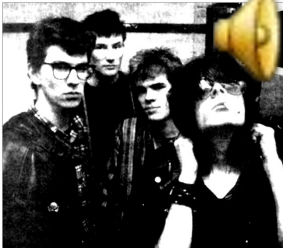
THE SISTERS OF MERCY

Субкультура готы сформировалась вокруг жанра готик-рок, одного из ответвлений новой волны. Основные группы этого жанра сформировались в конце 70-х — начале 80-х. Группы первой волны готик-рока — Sisters of Mercy, Bauhaus, Siouxsie & the Banshees, The Cure, Joy Division — были тесно связаны с панк-роком[3][7]. Однако от панка их отличали существенные музыкальные особенности: более медленный ритм исполнения, меньшая тяжесть, минорная мелодика. Многие группы (например, Sisters of Mercy) использовали драм-машины вместо живых ударных.