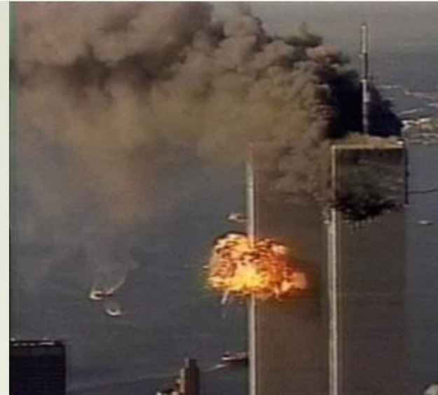
США. 11 сентября 2001 г.