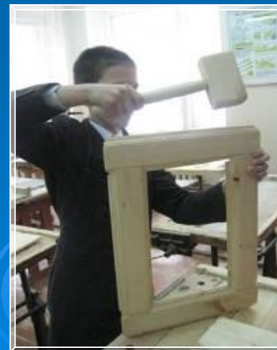
Соединение деталей изделия