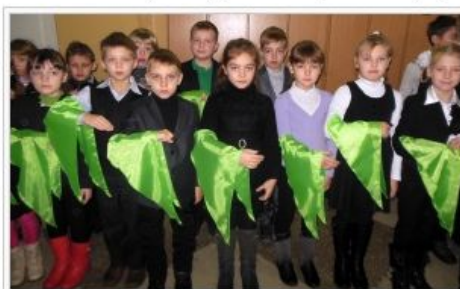
Посвята до «Країни Веселкової»