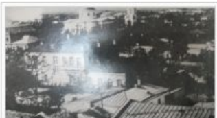
Старовинна будівля школи

На місці Вознесенської гімназії №1 наприкінці 70-х років XIX ст. була відкрита жіноча гімназія, яка була споруджена на кошти земства. 19 листопада 1864 року цар Олександр II підписав Статут, у якому йшлося про розвиток освіти, особливо на півдні України. За цим Статутом були відкриті повні (семирічні) та неповні (чотирьохрічні) прогімназії та гімназії, серед них і жіноча гімназія у місті Вознесенську. Це невелика двоповерхова будівля з чудово виготовленими в Херсоні залізними сходами, світлими класними кімнатами, гарним вестибюлем та невеликим залом.