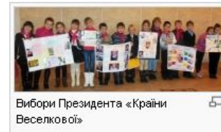
Вибори Президента «Країни Веселкової»