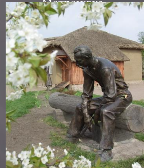
Пам'ятник П. Кулішу на хуторі Мотронівка