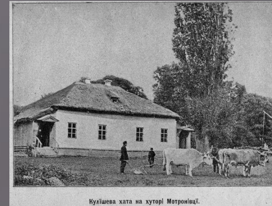
Кулішева хата на хуторі Мотронівці.

Тим часом світ швидко змінювався, душа поета не встигала за ним, хоча й мудрувала на самоті, долаючи духовні вершини. Із відблиском в очах молодого жару, у змаганні знесиленого тіла з творчим духом і пішов