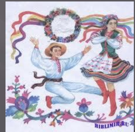
Картинка до твору “Орися”