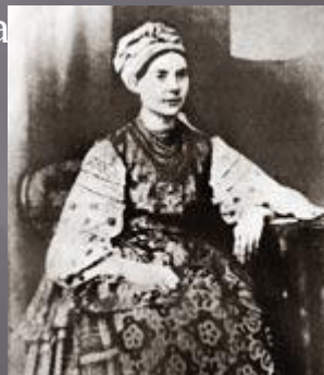
Олександра Михайлівна Білозерська дружина П. Куліша