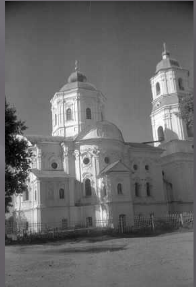
Вороніж, Шосткінський р-н. Сумської обл. Церква.