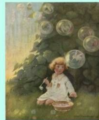
Ф.Т. Хантера. Фей мыльных пузырей. 1921 год.