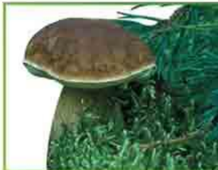
белый гриб (сосновый)