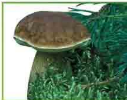
белый гриб (сосновый)