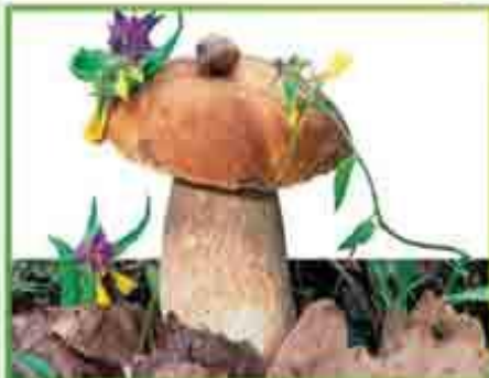
белый гриб (еловый)