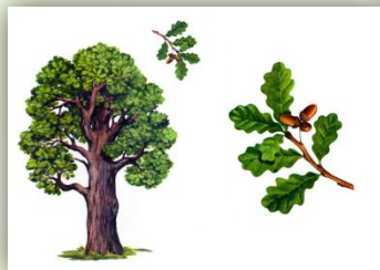
Дубрава (дубовый лес)