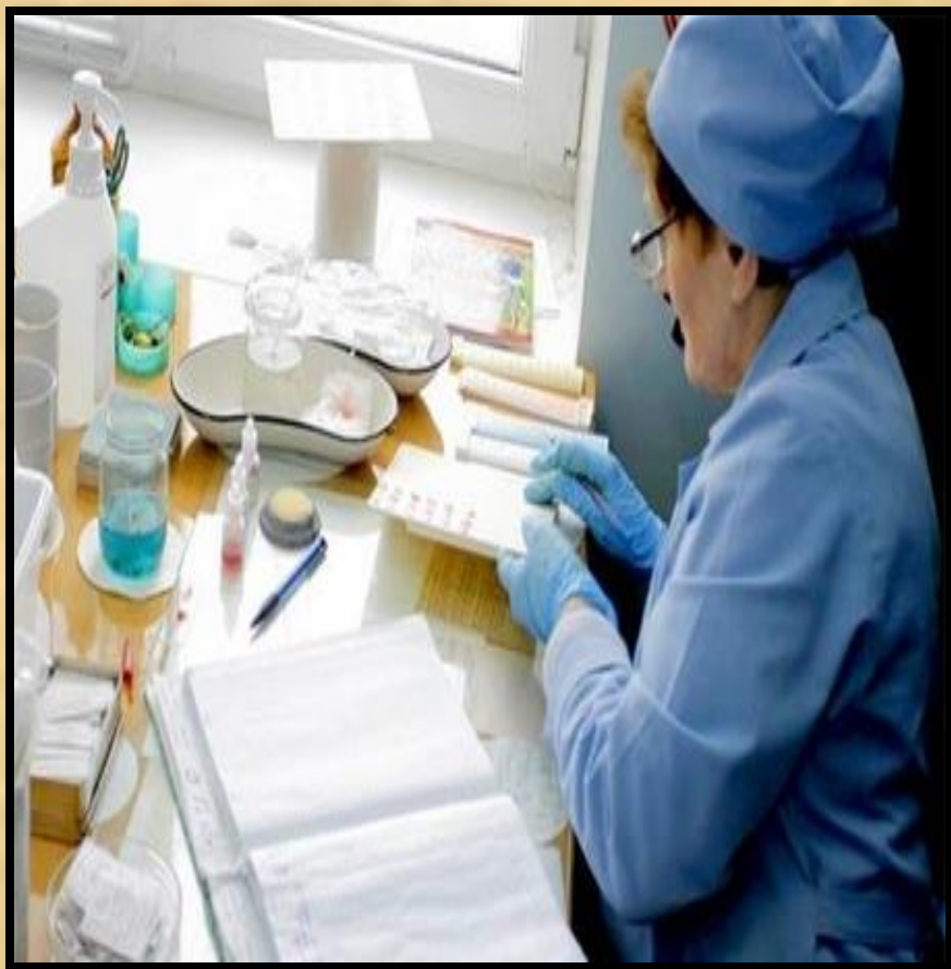
Любит делать доктор Лола, Всем прививки и уколы