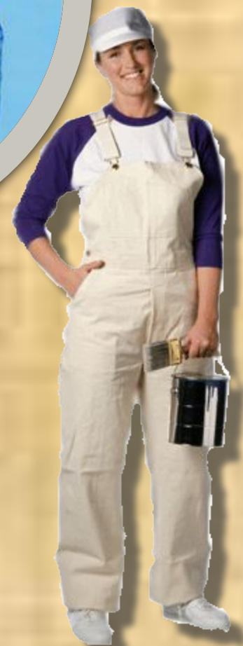
Виды одежды рабочих