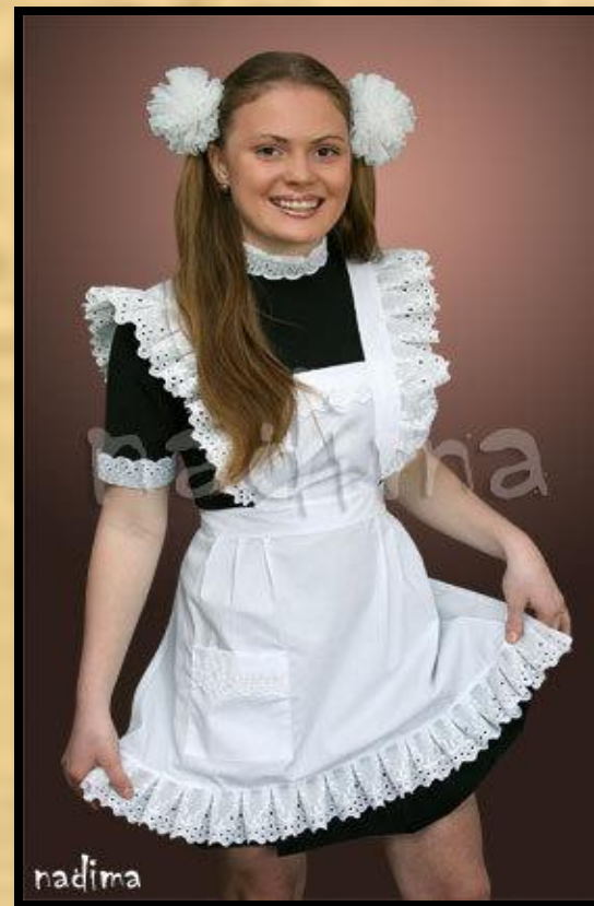
Такую форму носили до 1992 года

Школьная форма была введена в 1834 году для мальчиков. А в 1896 году появилось положение о гимназической форме для девочек.