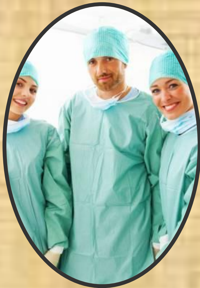
Такой костюм у докторов в операционной