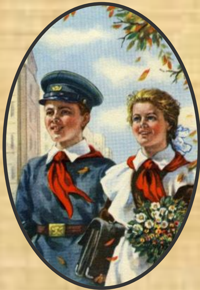
Это школьная форма образца 1948 года

Школьная форма была введена в 1834 году для мальчиков. А в 1896 году появилось положение о гимназической форме для девочек.