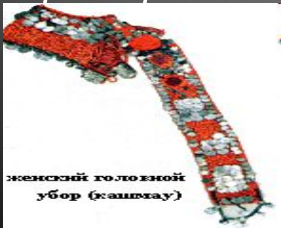
женский головной убор (каштгау)