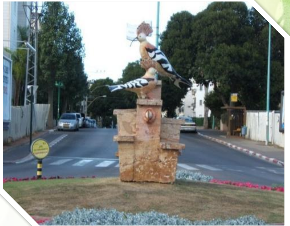
Памятник удо́ду на ул. Ротшильд в Петах Тикве.

В Израиле в результате всенародного голосования в 2008 году удо́д избран национальным символом этой страны.