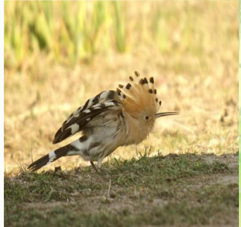
Возмущенный удод.

Характерной особенностью удода является хохолок на темени. Обычно он сложен, но когда эта птица чем-нибудь напугана или нервничает, она распахивает его в виде веера.