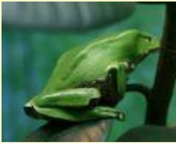
гигантская листовая лягушка