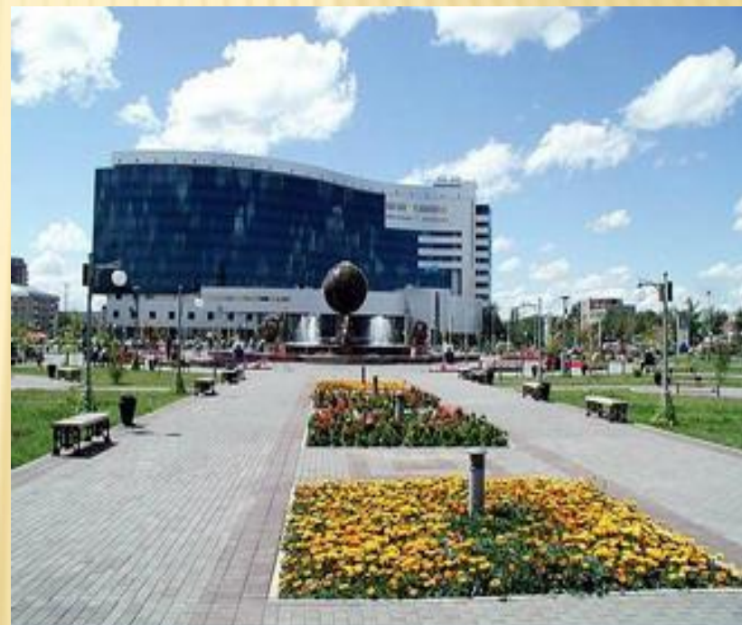
Астана – столица Республики Казахстан