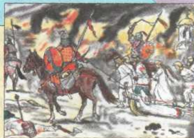
Набег на русское селение.