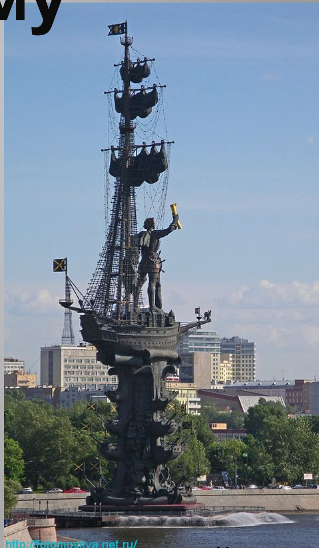
300 -летию российского флота