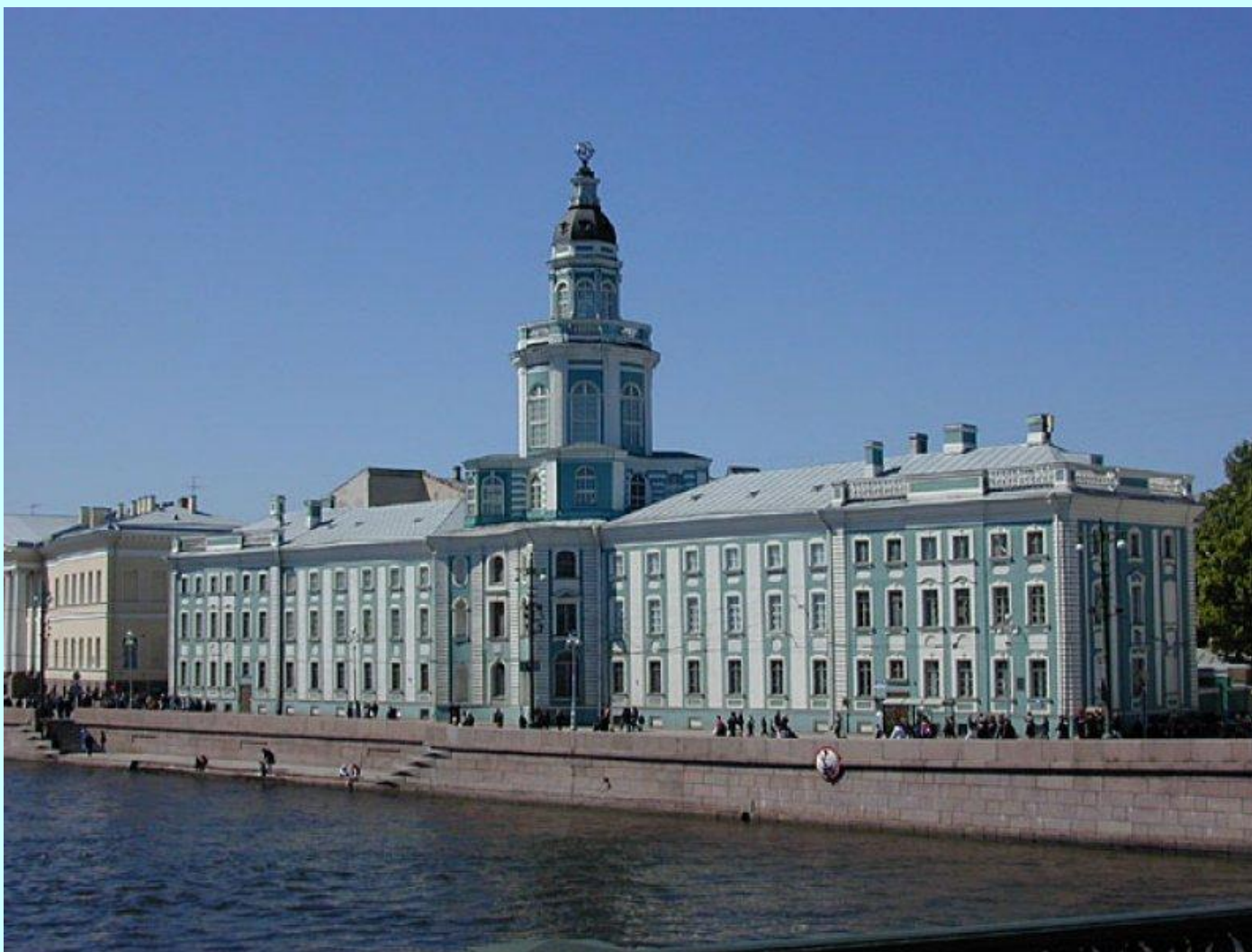
Кунсткамера. Арх. Георг Маттарнови, Николай Гербель, Михаил Земцов, Савва Чевакинский.