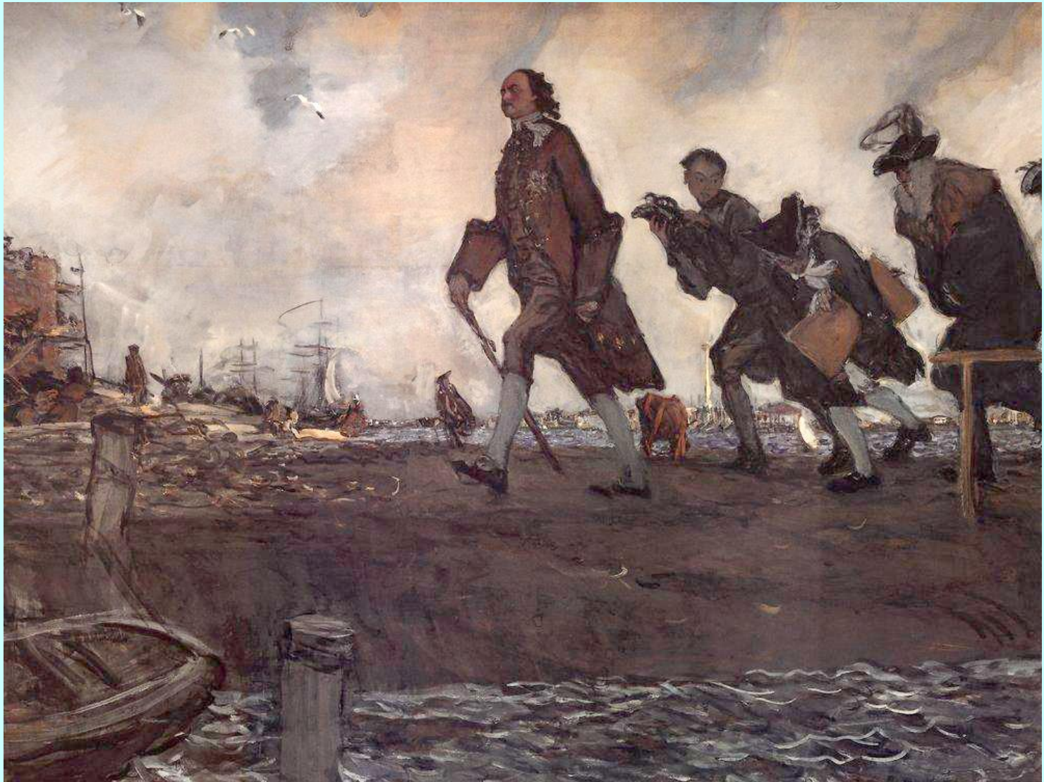
Пётр I Великий. Худ. Валентин Серов.