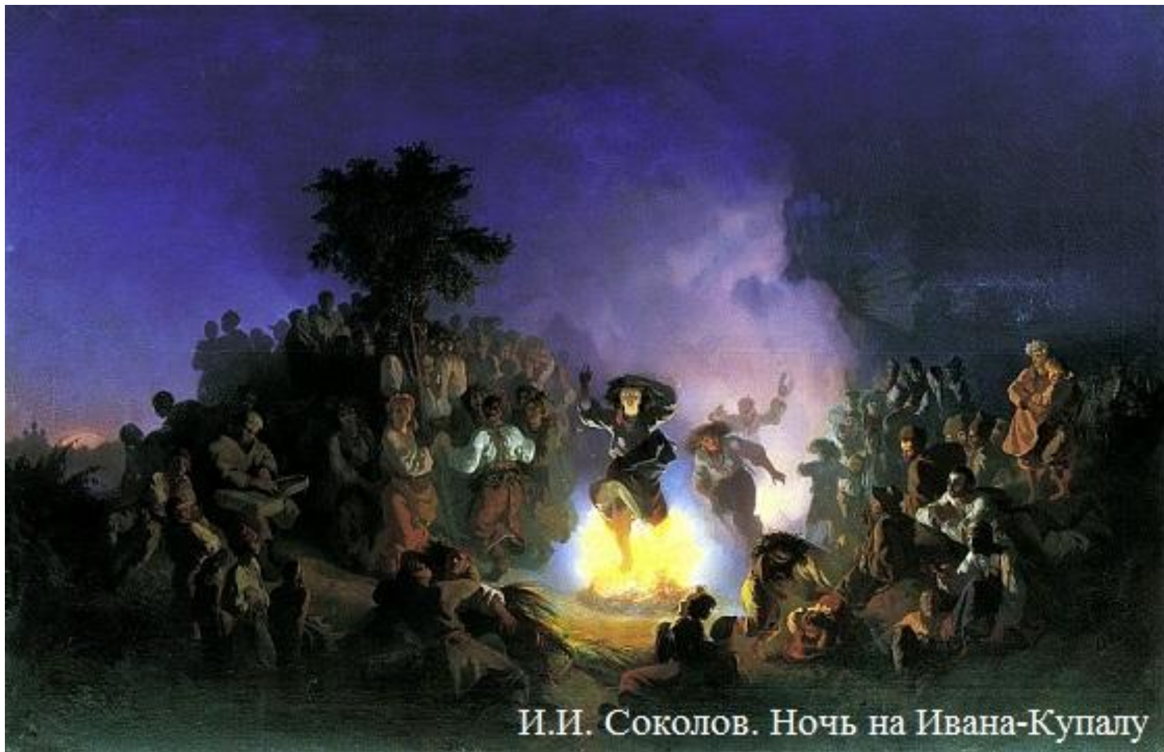
И.И. Соколов. Ночь на Ивана-Купалу