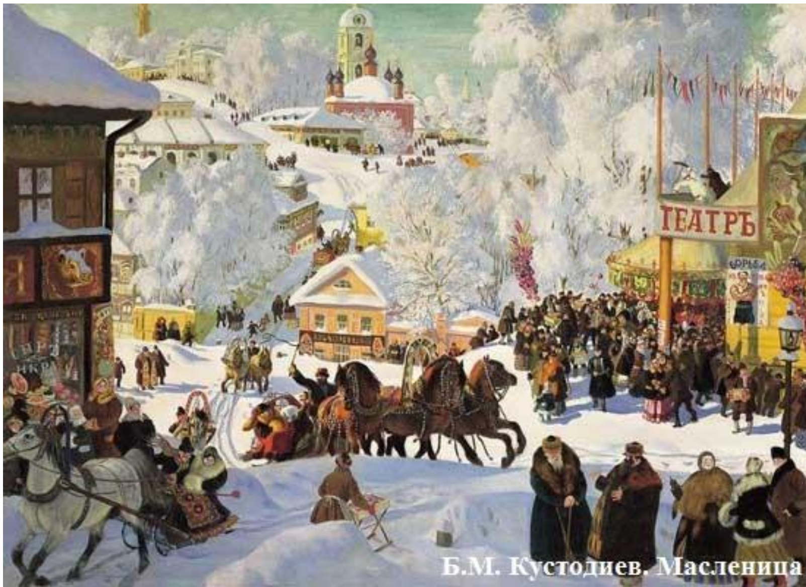
Б.М. Кустодиев. Масленица