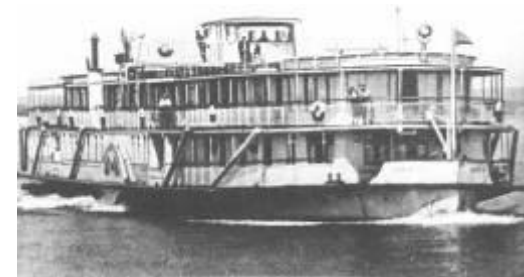
П/х СОБИНОВ Пост. 1932, Горький, з-д Кр. Сормово М - 365 лс, ск. - 14 км/ч, пас. - 91-450 ч., гр. - 250 т Б. "Каганович"