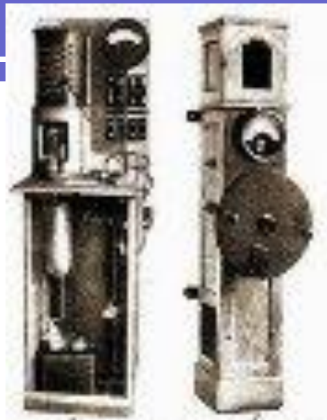
Modelle von Radioempfängern aus den 1920er Jahren