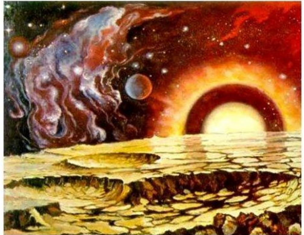
Планета в туманности IC443