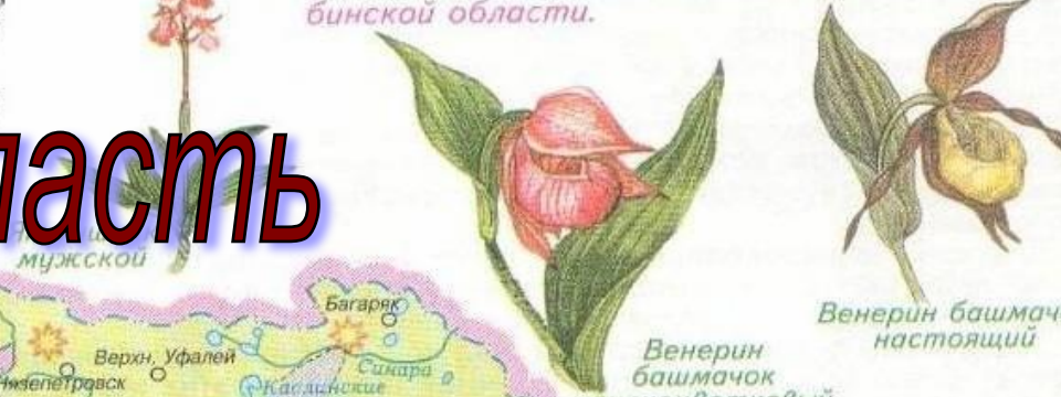
Венерин башмачок крупноцветковый