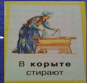
В корыте стирают