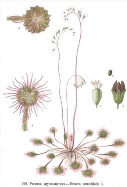
208. Рослянка круглолистная — Drosera rotundifolia L.