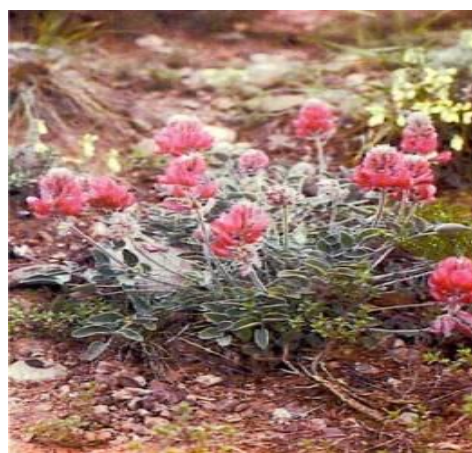
Копеечник серебри СТОЛИСТНЫЙ