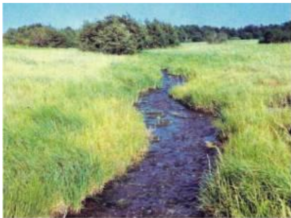
Ручей Кайнар в Буртинской степи