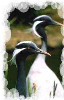
Журавль - красавка