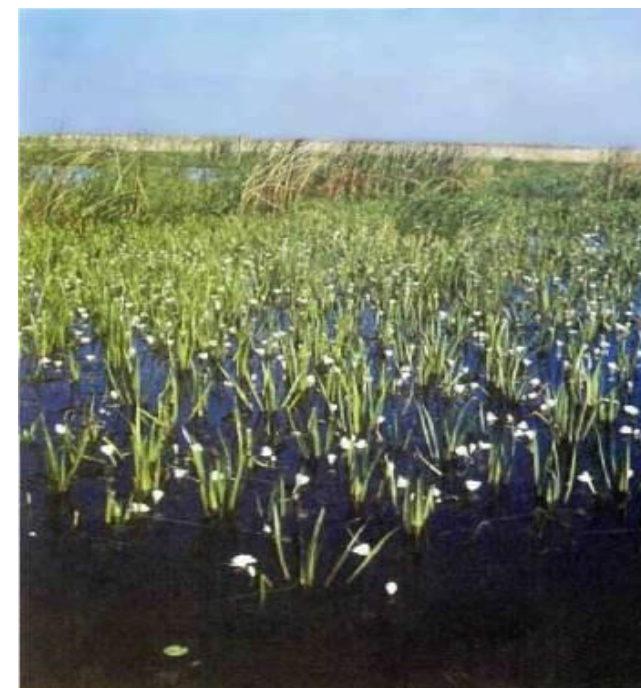
Озеро Журманколь в Ащисайской степи