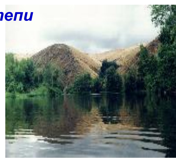
Шайтан - гора

“Айтуарская степь” представляет южную часть Оренбургской области и занимает левобережье реки Урал по границе с Актыубинской областью Республики Казахстан. Название дано соответственно речке и поселку Айтуар.