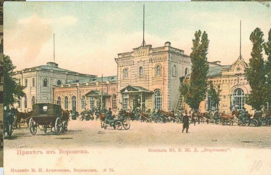
Привѣтъ изъ Воронежа.