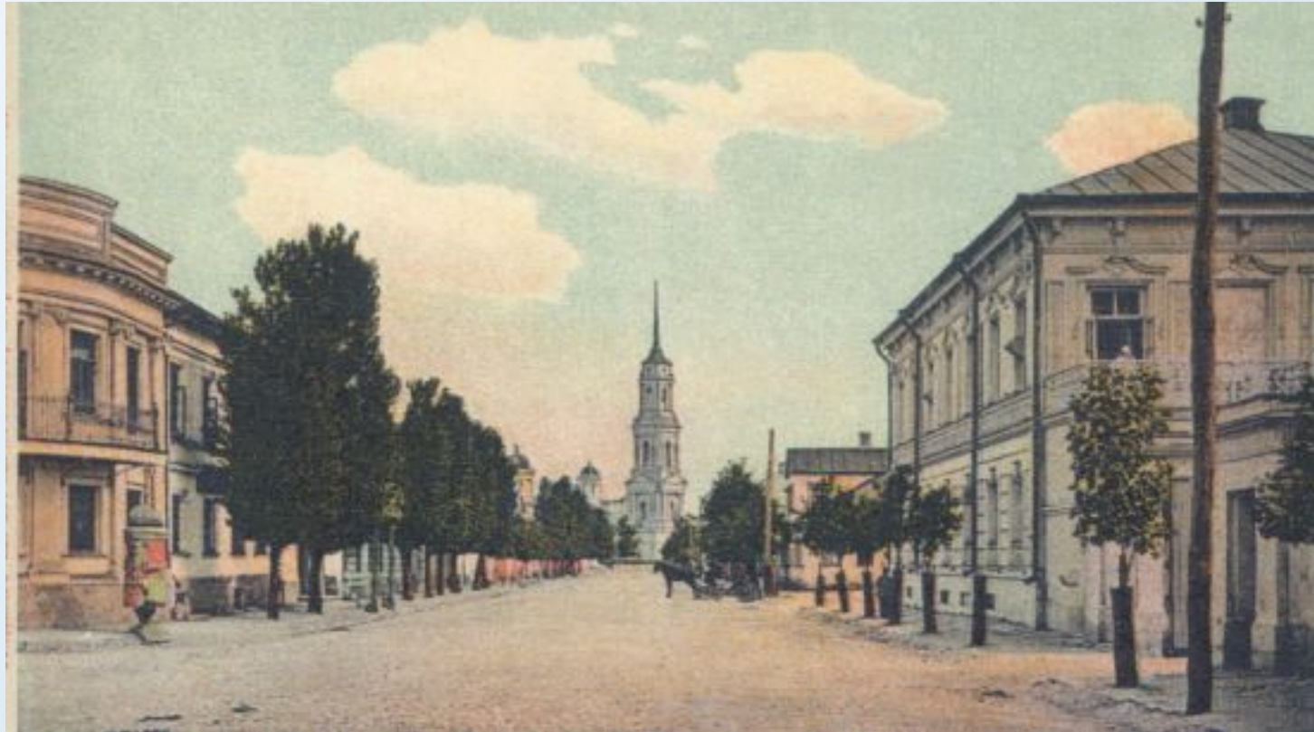
Ул. Платонова. Общий вид. До революции.