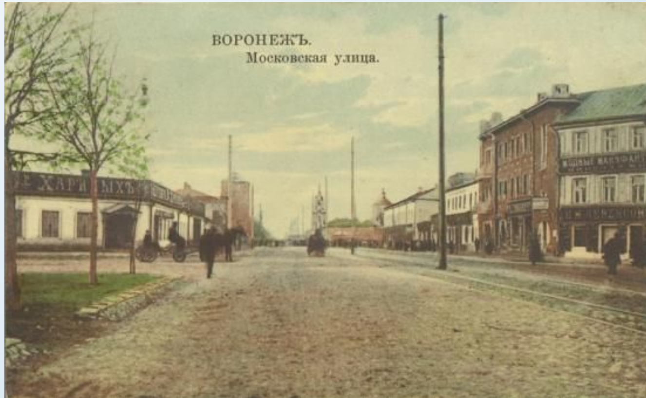
Ул. Плехановская. Общий вид. До революции.