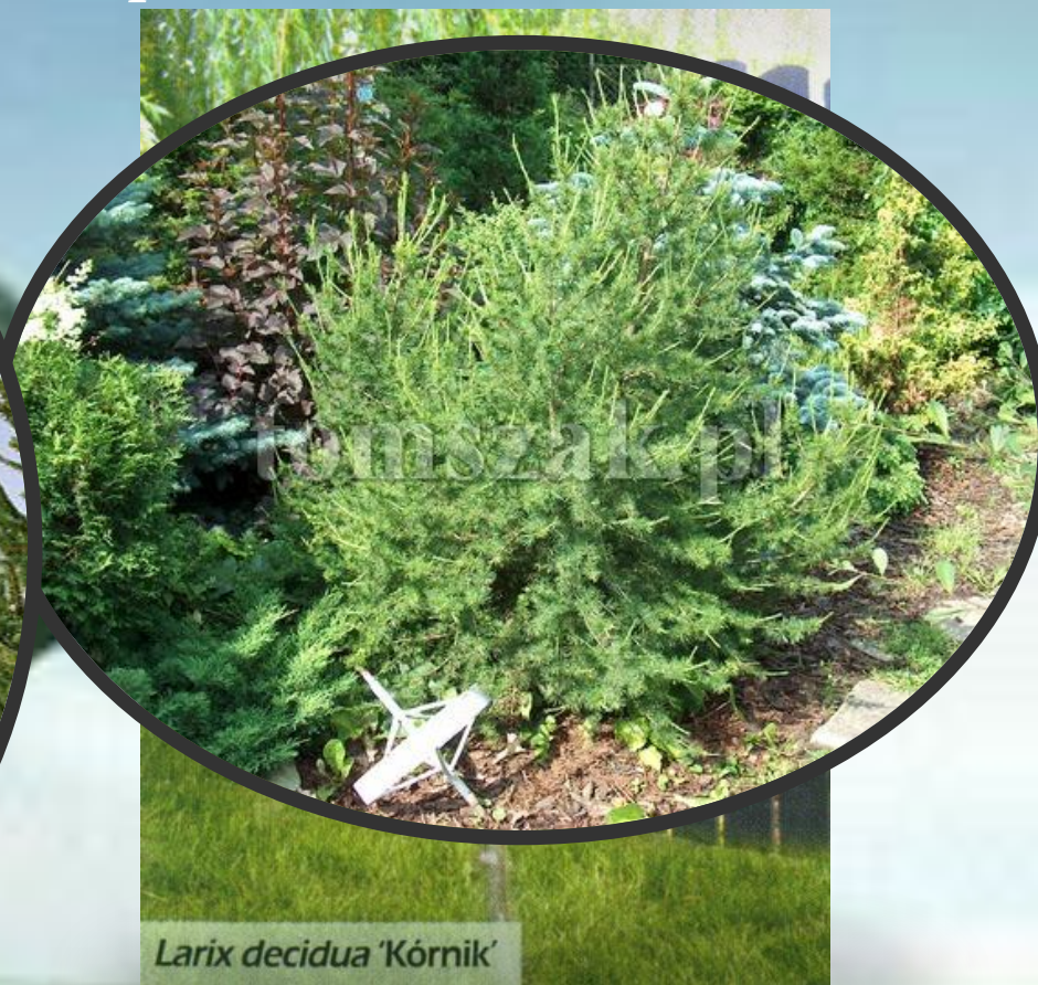
Larix decidua 'Kornik'