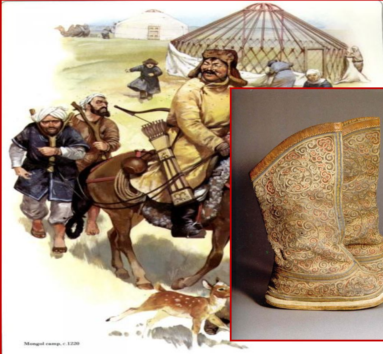
Mongol camp, c.1220