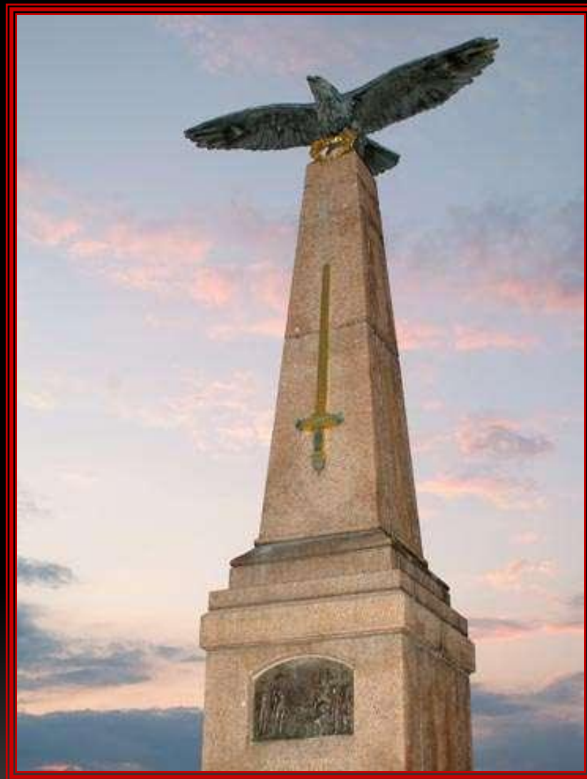
Памятник на командном пункте Кутузова