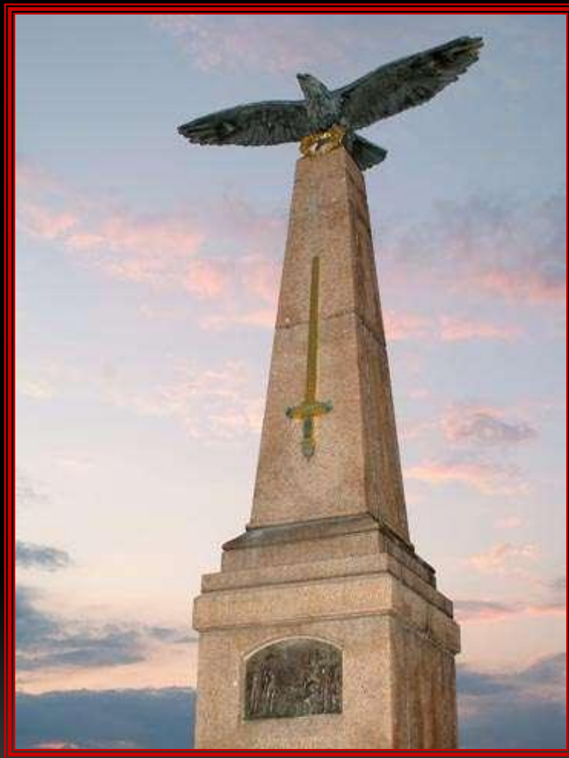
Памятник на командном пункте Кутузова