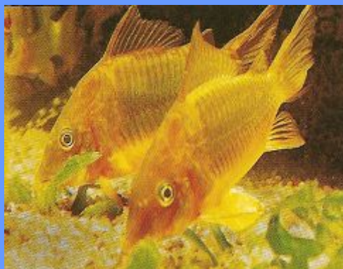
Сомики - настоящие «мусорщики»