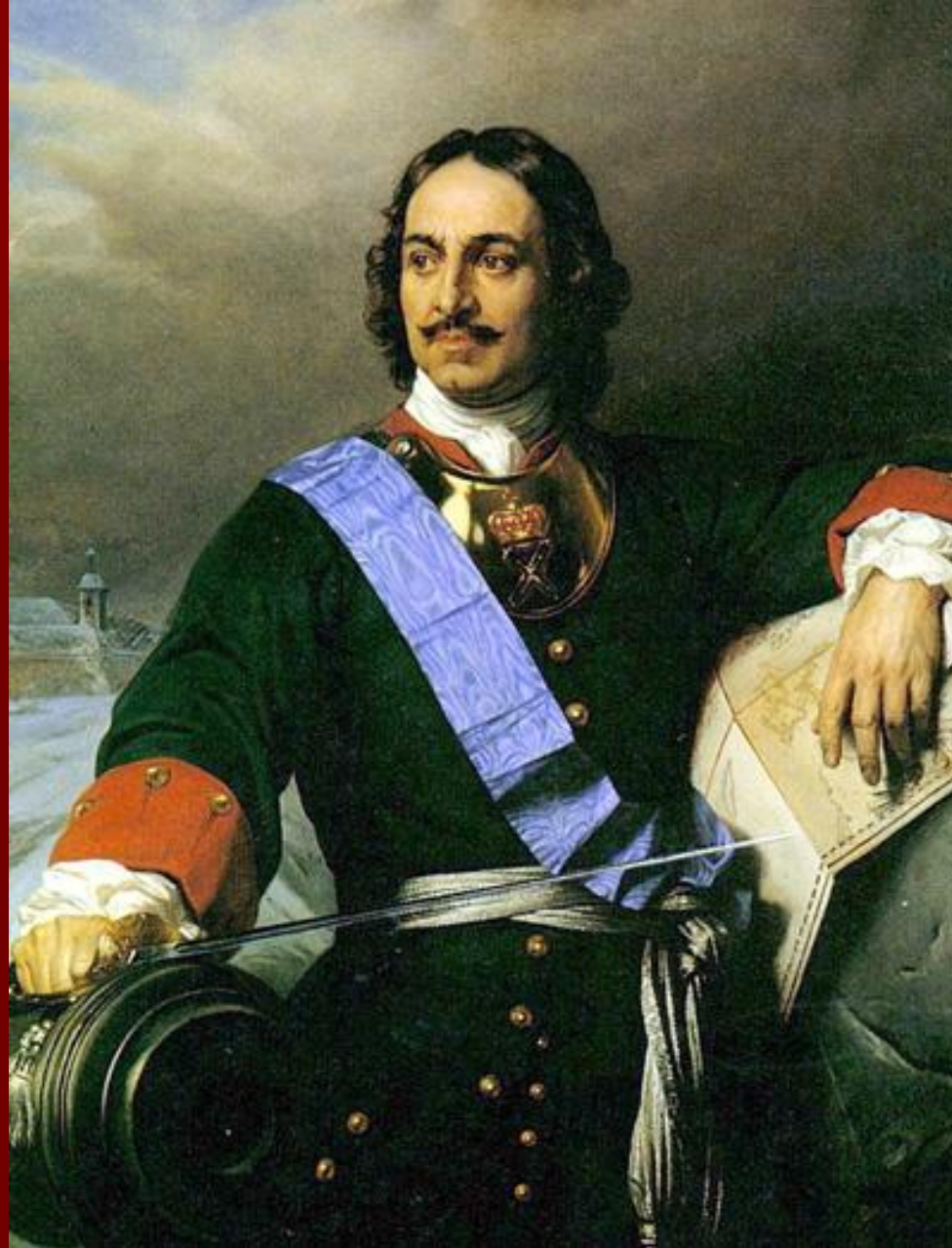
Царь Пётр I