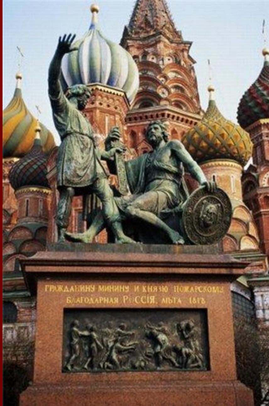
Храм Василия Блаженного и памятник Минину и Пожарскому