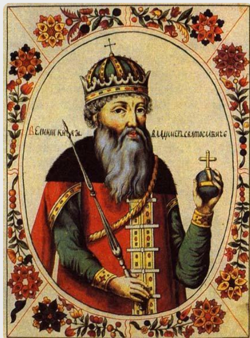
Владимир Красное Солнышко