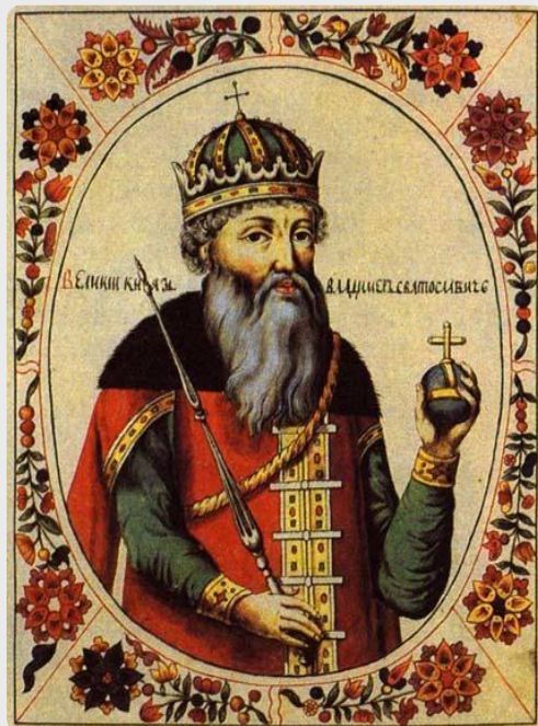
Владимир Красное Солнышко