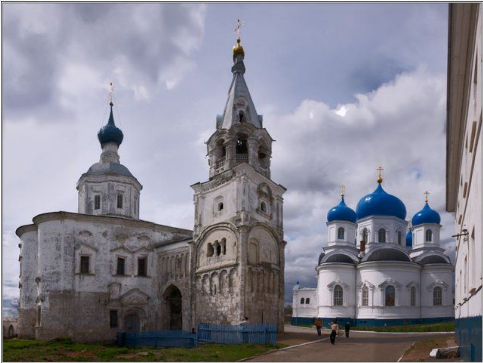
Храм Рождества Богородицы и Лестничная башня