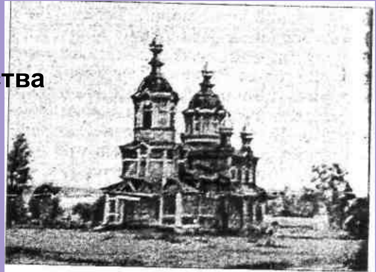
Церковь Божией Матери Казанской. с. Большая Выла.

Церковь Божией Матери Казанской построена в с. Большая Выла на средства прихожан в середине 1740 –х гг., вторая – в 1784, последняя 1906, однопрестольная. Церковь была деревянная, теплая, длинная с колокольней 13 саж., наибольшая ширина 6 саж. Закрыта в 1940 году . Икона Божией Матери Казанской способствовала возвышению православия среди народов Сред. Поволжья после взятия Казани в 1552.(В 1579 девятилетней дочери стрельца Онучина явилась в сонном видении Богоматерь и повелела достать Её (икону), закрытую в землю тайными последствиями православия еще во время господства ислама. Так была обретена икона, которая стала святыней.) Церковные праздники: 21 июля - летний Казанский. 4 ноября - зимний Казанский.