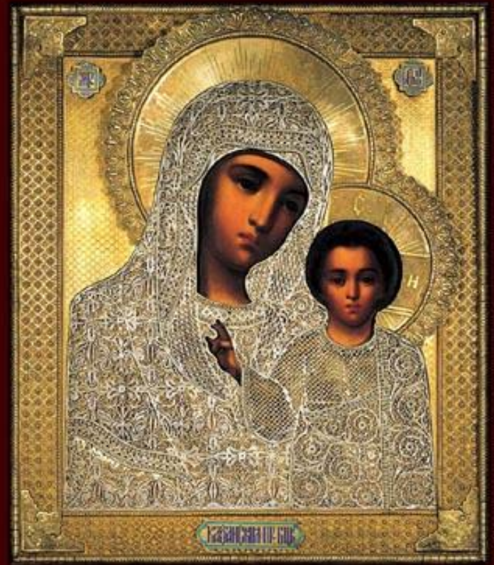
Казанская икона Богородицы в окладе (XIX век)

На месте явления иконы был построен Богородицкий девичий