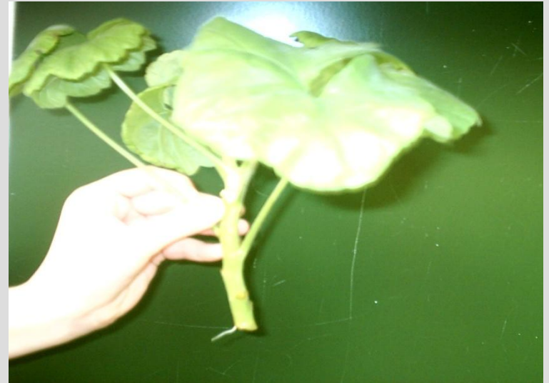
Черенок, который стоял в воде в тёплом месте, через неделю дал корешок