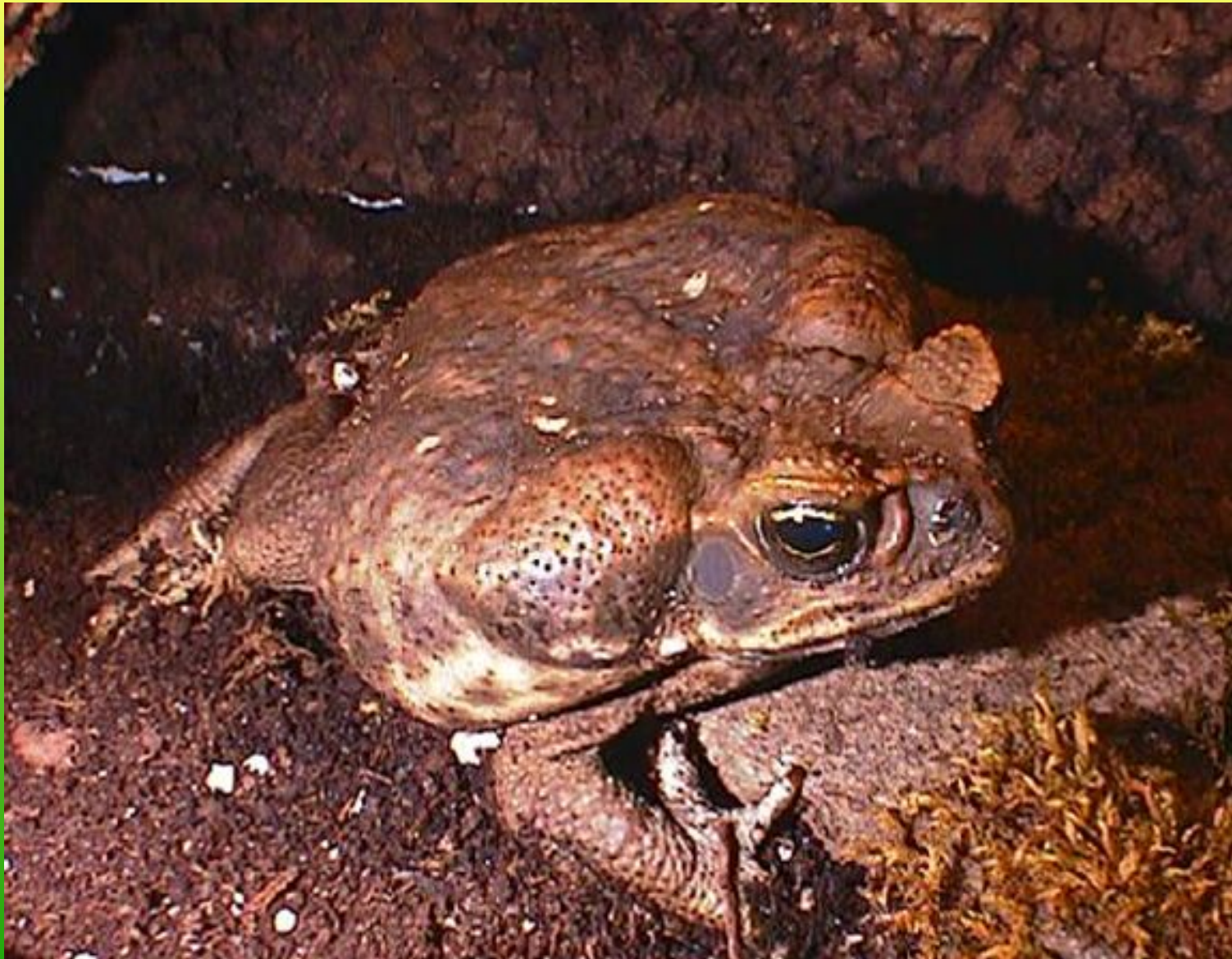
Жаба – ага (гавайская жаба)