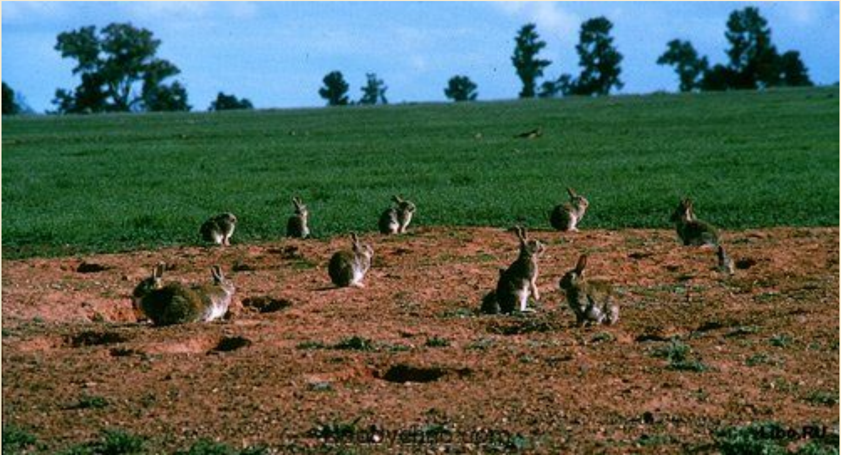
Пастбище, пораженное эрозией. Следствие массового размножения кроликов в Австралии.