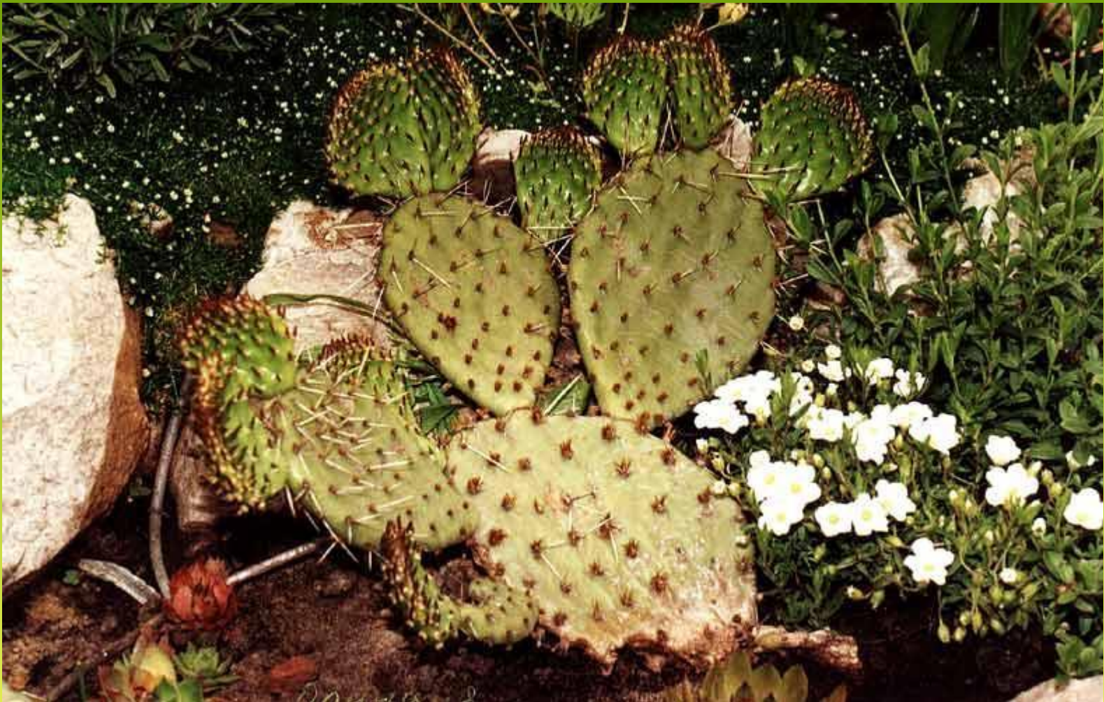
Кактус опунция – вид интродуцент