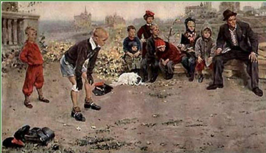
С.А. Григорьев «Вратарь» 1949 г