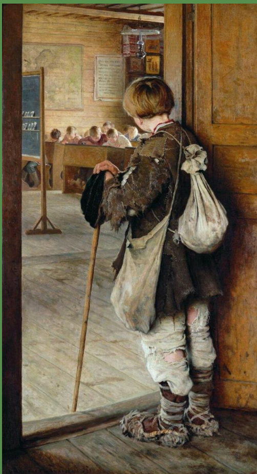
Н.П.Богданов-Бельский "У дверей школы" 1897

До 1917 года портфель носили только дети богатых родителей, которые учились в гимназиях. Он был из черной кожи, крышка обшита тюленьим мехом серо-зеленого цвета.