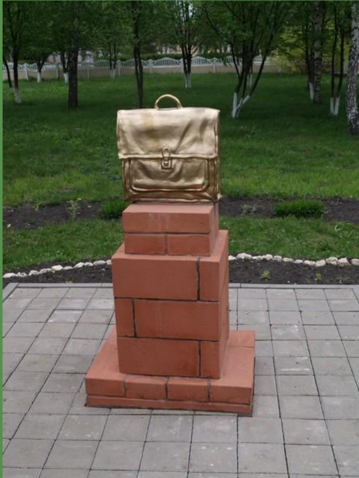
Венгеровская средняя школа в Белгородской области Автор скульптурной композиции А.Н. Беликов

Памятник простому школьному портфелю установлен в Белгородской области