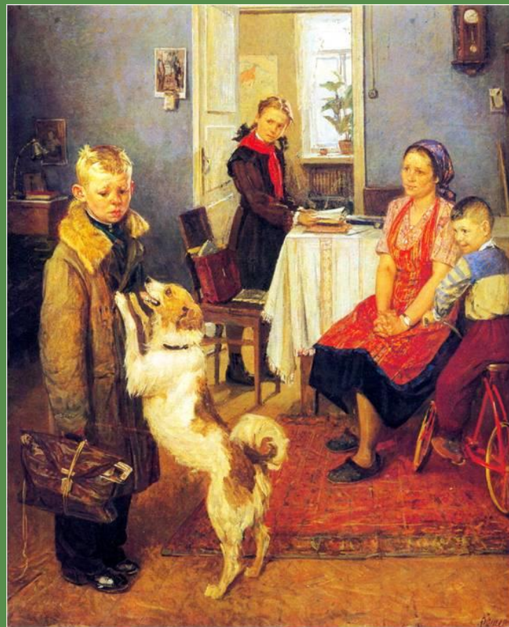
Ф.П. Решетников «Опять двойка» 1952 г