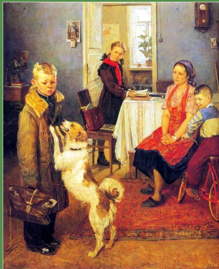
Ф.П. Решетников «Опять двойка» 1952 г