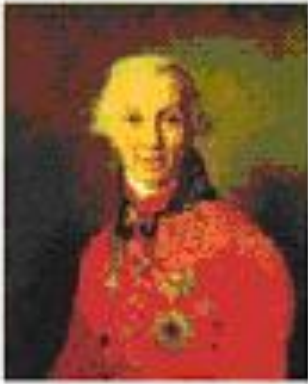
Гавриил Державин Художник В.Боровиковский 1811 г.

Первым гимном России (правда, неофициальным) можно считать марш «Гром победы раздавайся». Этот марш в 1790 г. был написан поэтом Гаврилой Державиным и композитором Иосифом Козловским в честь героического взятия русскими войсками (под командованием великого полководца Александра Суворова) неприступной турецкой крепости Измаил.