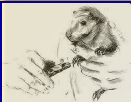
Так следует держать в руке морскую свинку при подстригании когтей.