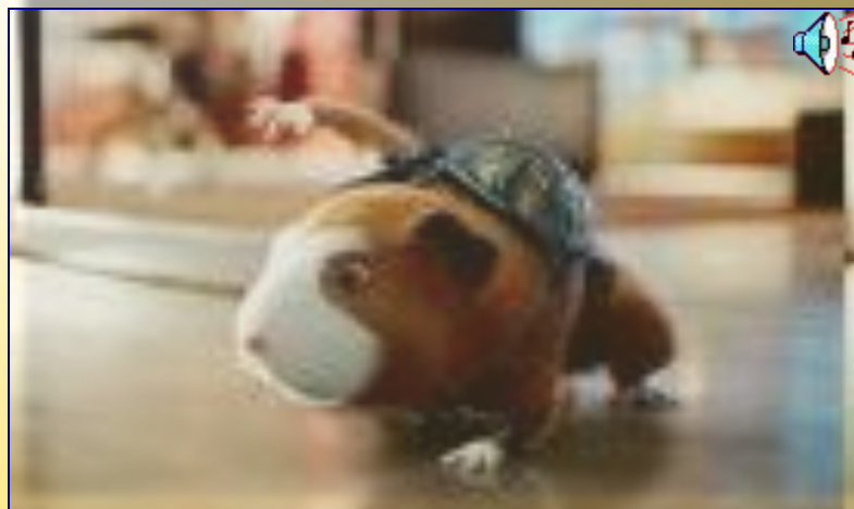
Я страшно сердит