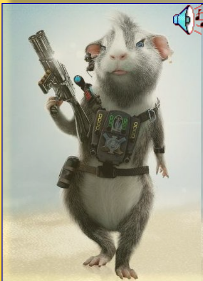
Ну чего пристали?