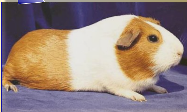
Морская свинка – лабораторное животное

Незаменима она при изучении вопросов, связанных с питанием человека и, особенно при изучении действия витамина С.