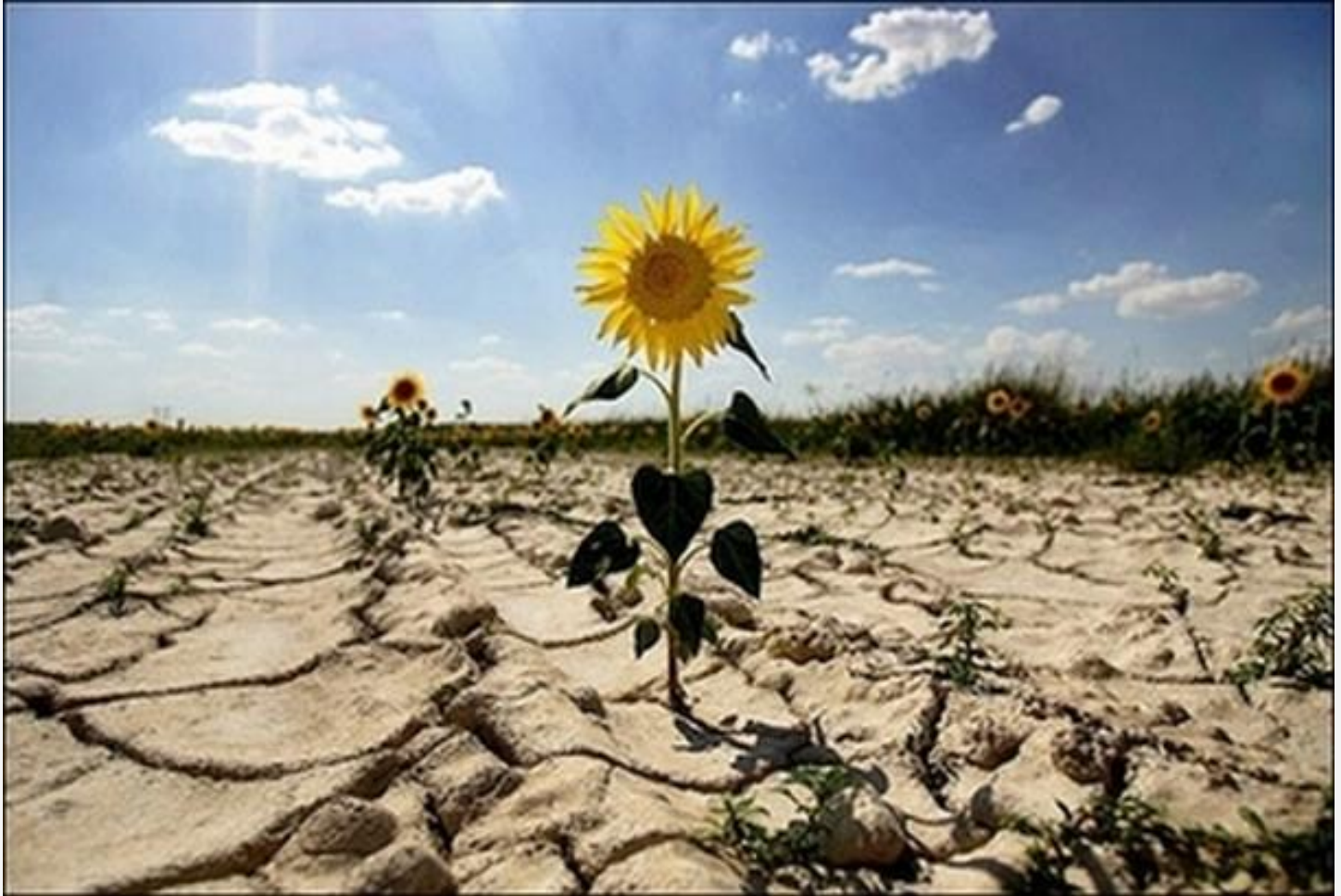
Извержение вулкана засуха

Часто причиной гибели диких животных являются природные явления.