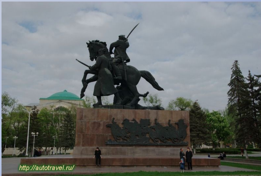
Памятник бойцам 1-й конармии