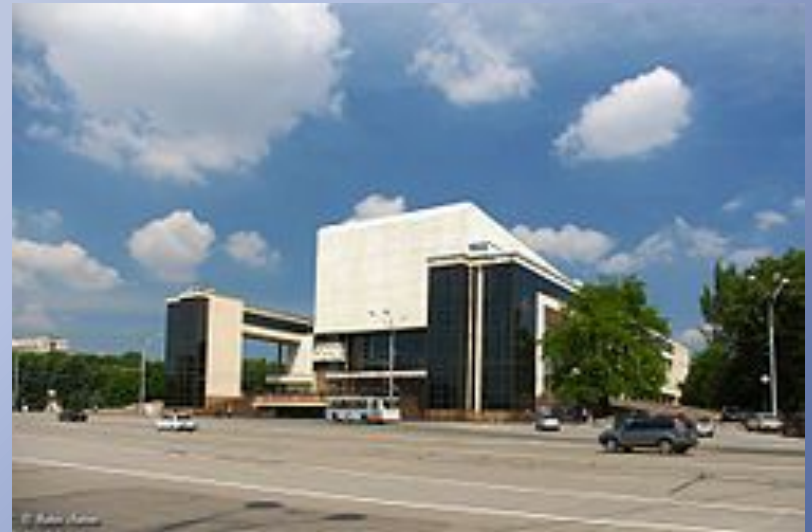
Ростовский академический театр драмы им. М. Горького