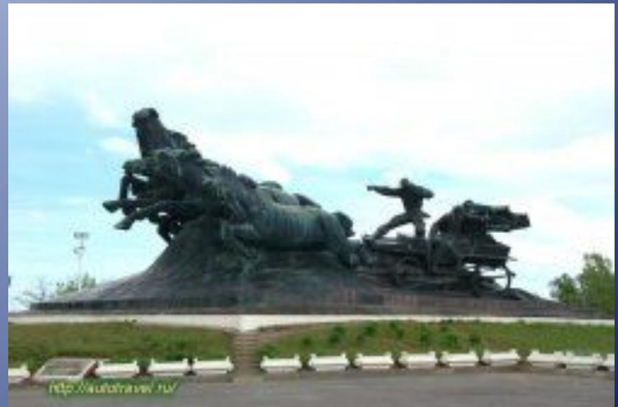
Памятник 1-ой конной армии "Тачанка"