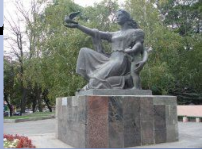
Памятник "Дающая жизнь"