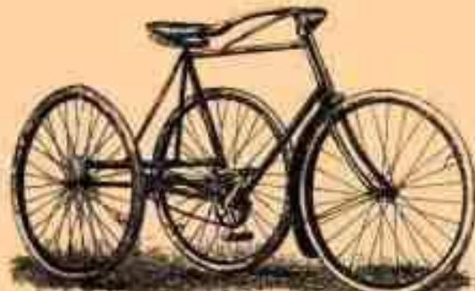
8. Трёхколёсный В.