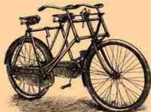
6. Двухместный (обыкновенный) В.