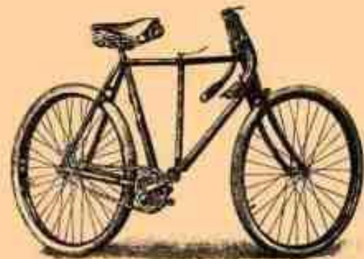
3. Велосипед (обыкновенный) В.