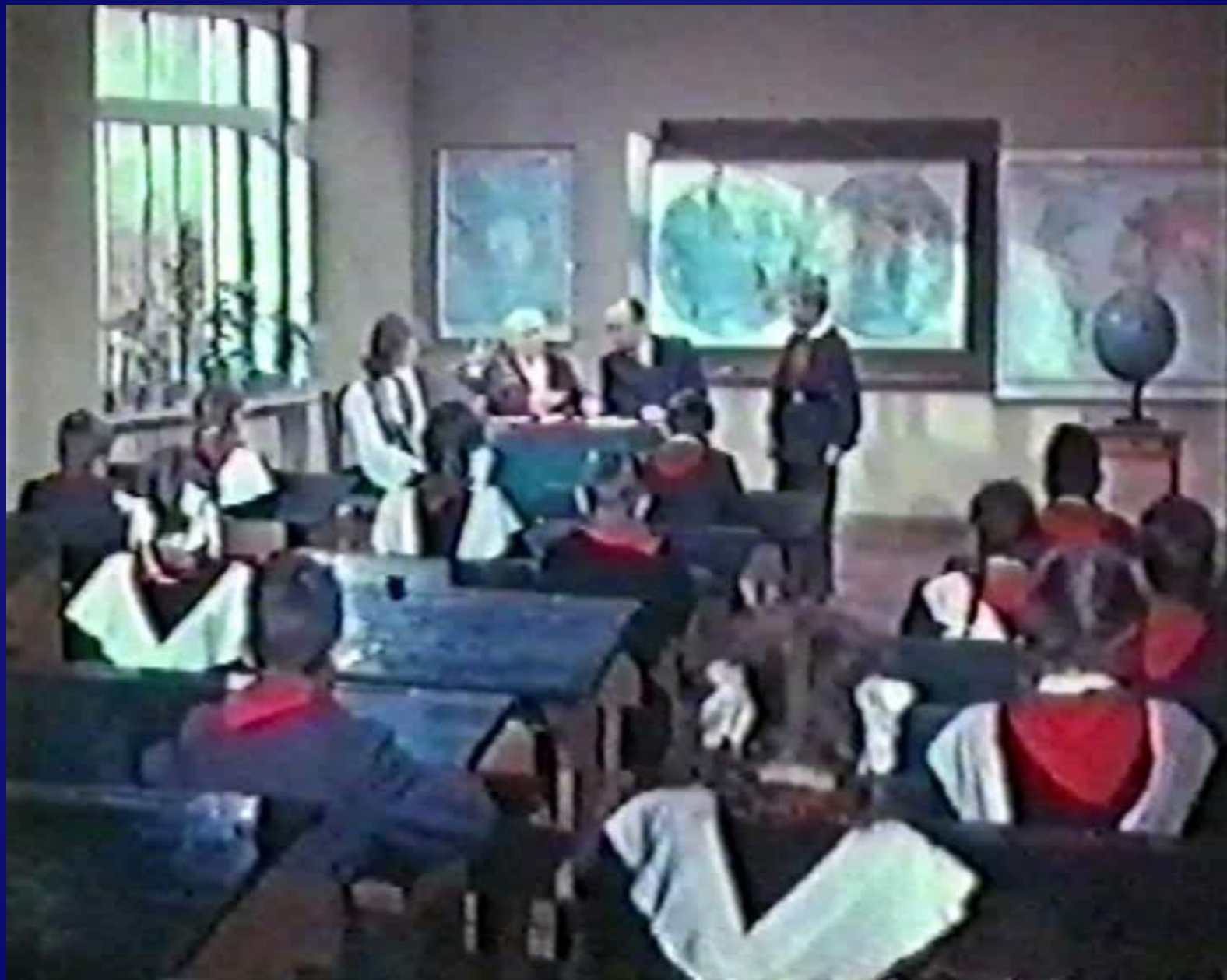
Кадры из кинофильма «Старик Хоттабыч»