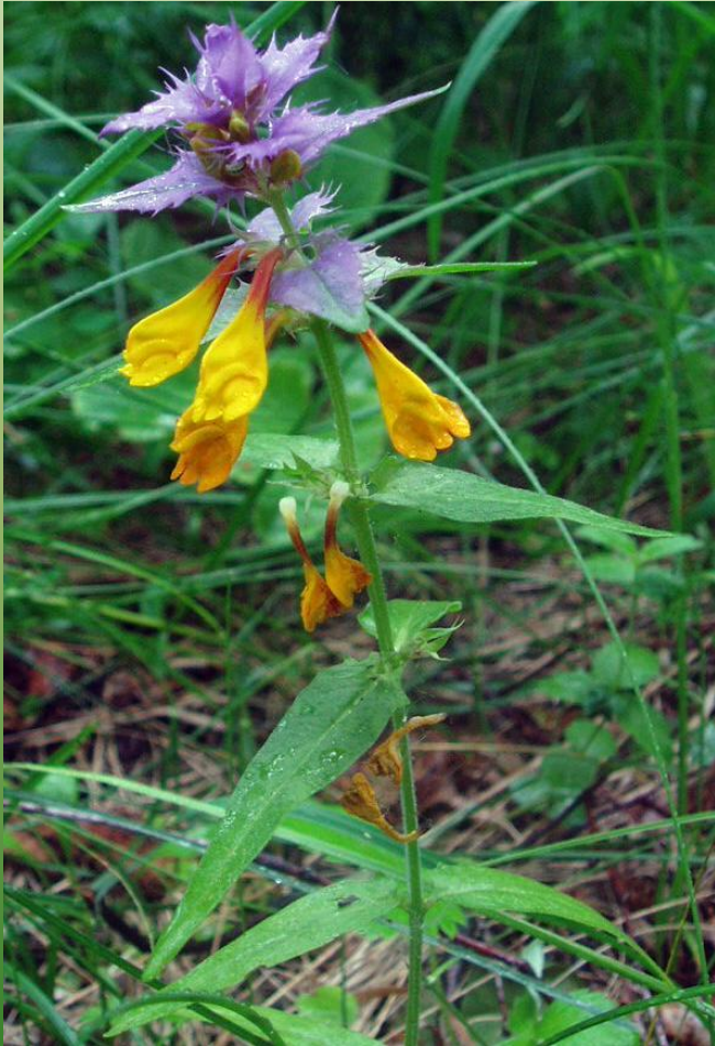
Иван–да–марья (марьянник дубравный)