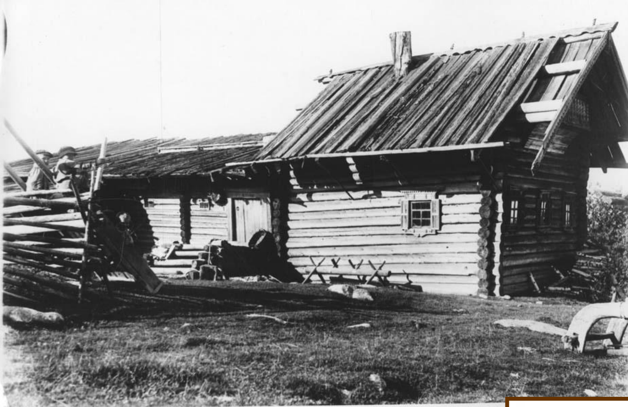
Курная изба. Фото начала XX века.