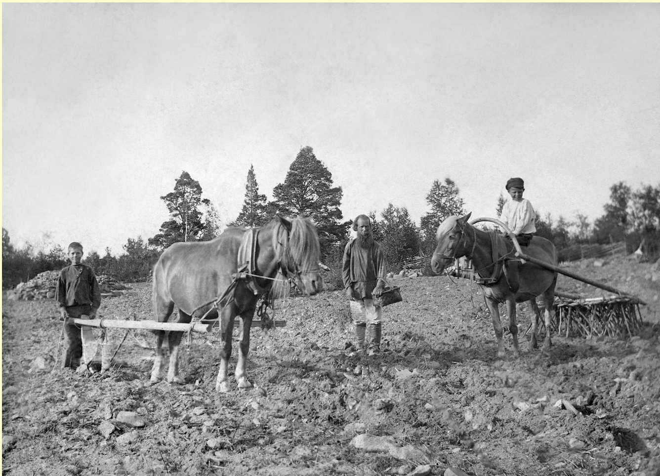
Пахота и сев в Олонецкой губернии. Фото начала XX века